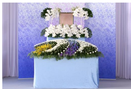
花祭壇 B タイプの場合