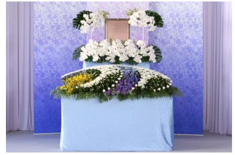
花祭壇 B タイプの場合