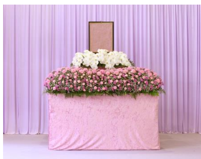
花祭壇 A タイプの場合