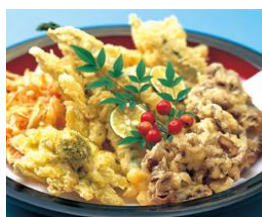
寿司・揚げ物・煮物・香の物